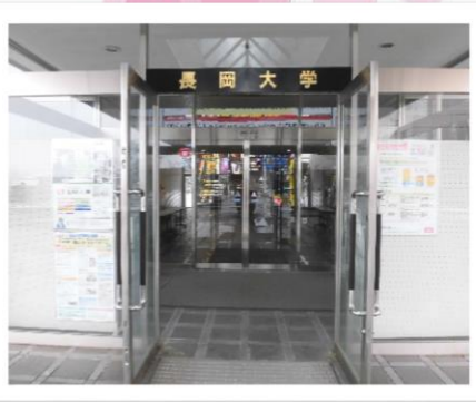
広くて明るい学生食堂