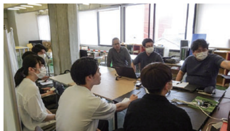
TESONAとの打ち合わせ風景