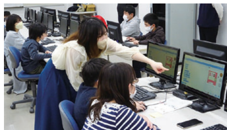
プログラミング教室