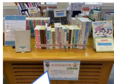
就活応援図書コーナーは カウンターの正面にご 置いています！

このコーナーには仕事や企業について学べる本や就活能力を高める本、 書く力を高める本など様々な役立つ本が集められています！ 今回は、その一部を紹介したいと思います。