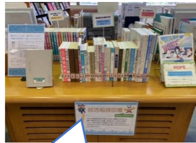
就活応援図書コーナーは カウンターの正面にご 置いています！

このコーナーには仕事や企業について学べる本や就活能力を高める本、 書く力を高める本など様々な役立つ本が置かれています！ 今回は、その一部を紹介したいと思います。