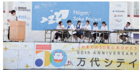
県内大学生が企画した「鮭プロフェス」。23年9月に新潟市の万代シティパークで開かれた