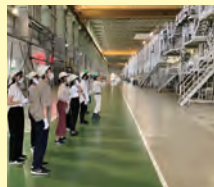
※インターンシップの様子

新潟県は創業100年を超える企業数が全国でも上位にあり、伝統の継承と時代に合わせた革新を繰り返しながら国内外で高い評価を得ている企業が多くあります。本科目は、新潟地域連携コミュニティ主催のインターンシップ体験事業 ※ を活用し、夏と春の長期休業期間に約1週間にわたり県内複数企業への訪問や社員取材を交えて実施します。新潟県内企業の魅力・強みと、それを生み出す背景や風土を深く理解するとともに、自身のキャリア観について新たな気づきを得ることもねらいとしています。