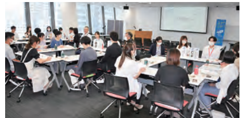
新潟市のメディアシップで23年8月に開かれた「鮭プロにいがたカフェ」。大学生と県内企業若手社員が交流した