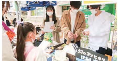
新潟県若手人材等による地域課題解決提案事業