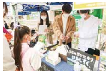
R3年度新潟県若手人材等による 地域課題解決提案事業(専修大学森本ゼミ)