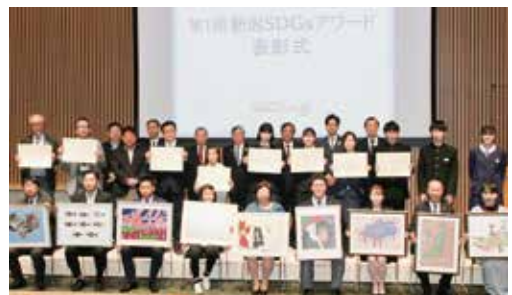
第1回SDGsアワード表彰式 (2021年3月・新潟市中央区のメディアシップ)