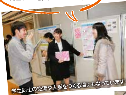
学生同士の交流や人脈をつくる場にもなっています!

「ブラッシュアップ・意見交換会」では、活動途中の過程での悩みや課題について他グループとアドバイスやアイデアを交換できるので活動を見直すよい機会になっています。