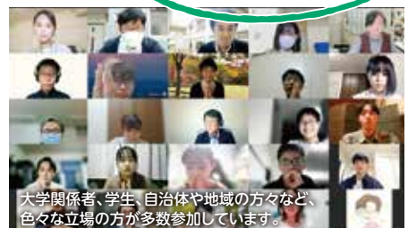
大学関係者、学生、自治体や地域の方々など、色々な立場の方が多数参加しています。

これによって、学生の学外活動・地域活動を展開するエリアや活動テーマが拡大していき、学生の皆さんと地域との関わり方がもっとバラエティに富んだものになることを期待しています。