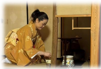
【マーケティングサークル】