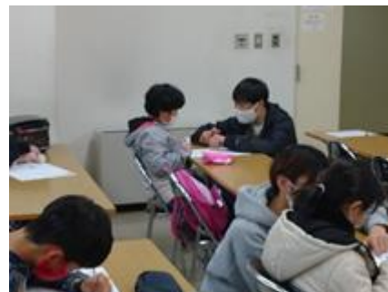
【長岡大学レオクラブ】